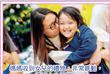
媽媽收到女兒的禮物，非常感動，場面十分溫馨。