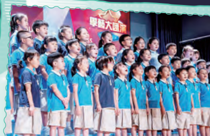
初小合唱團在校際音樂節獲教堂音樂組銀獎。