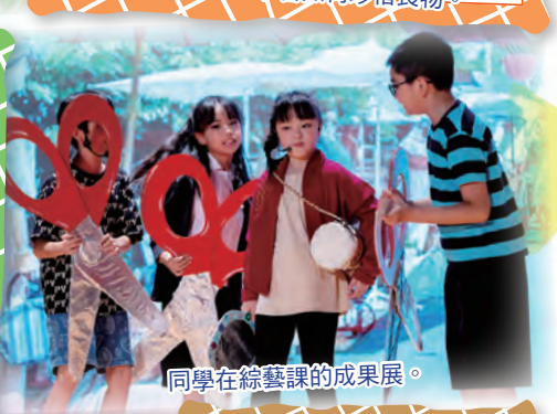
同學在綜藝課的成果展。