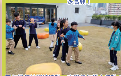
四年級領袖訓練活動，守護低年級大行動！