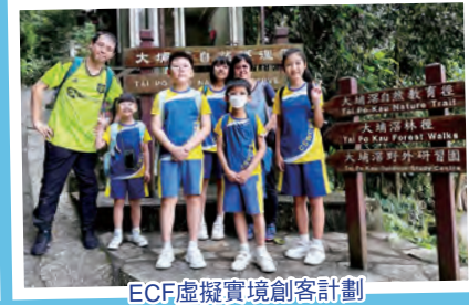
ECF虛擬實境創客計劃