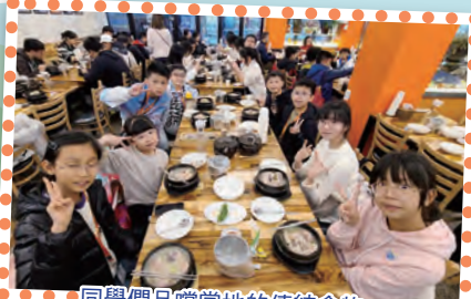
同學們品嚐當地的傳統食物。