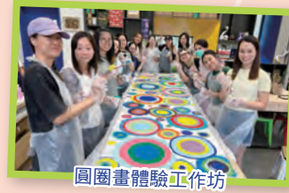
圓圈畫體驗工作坊