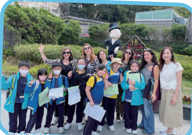
Using English in an authentic context during outdoor excursions.