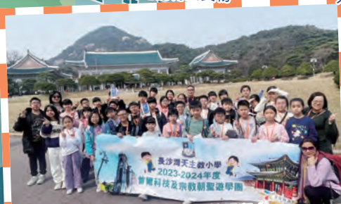
師生在著名的景點上拍照留念。