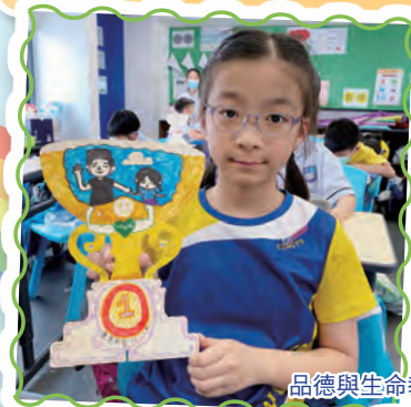
品德與生命教育課「孝親」