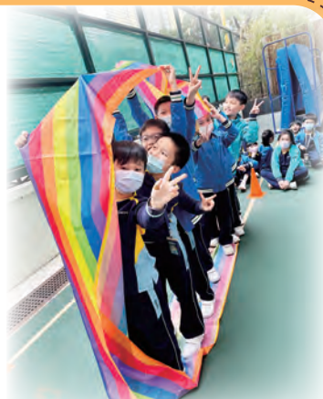
至正Fan Fun Club

宗教及道德教育發展組更推行小三全級多元智能課校本正向課程——「至正Fan Fun Club」，學生透過活動，不怕失敗，勇於接受挑戰，提升社交智慧及培養團隊精神。