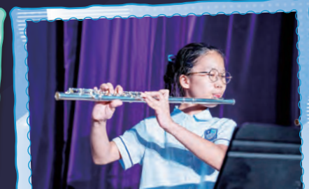
同學以長笛為大家吹奏《龍貓》。