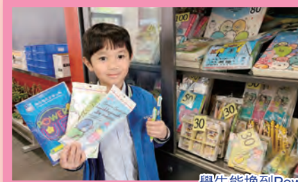
學生能換到Power Up禮物，心情興奮！