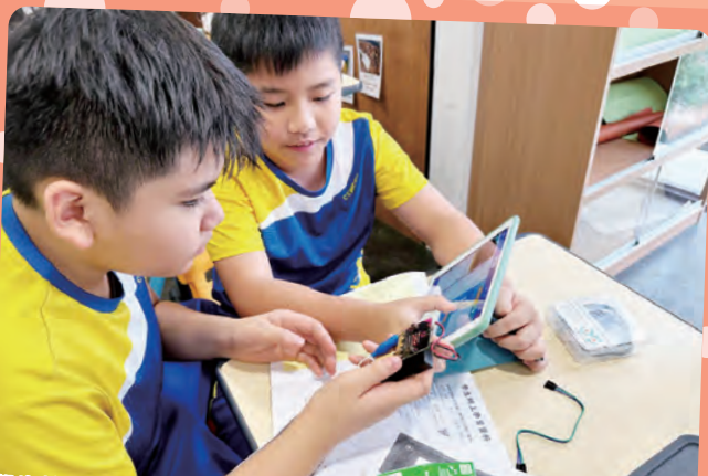
學生於校本電腦課中，為「健康使用互聯網」設計作品，優化生活。