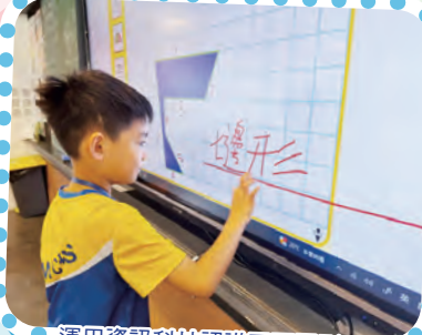
運用資訊科技認識平面圖形。