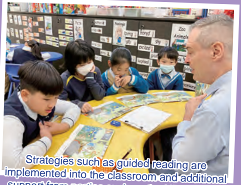
Strategies such as guided reading are implemented into the classroom and additional support from parties such as the NET section fosters a language rich learning atmosphere.