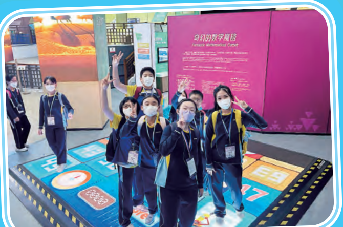
小六深圳航空與科技探索之旅