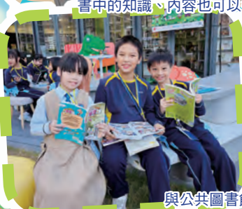
與公共圖書館合作推動閱讀——與小恐龍共讀