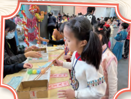
寓學習於娛樂，多有趣！