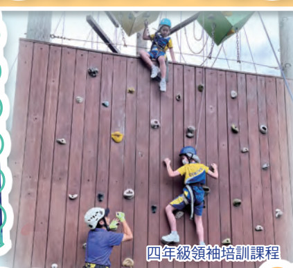
四年級領袖培訓課程