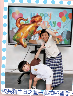
校長和生日之星一起拍照留念，多高興！