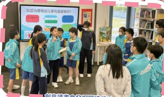
創意讀書會發掘閱讀領袖。