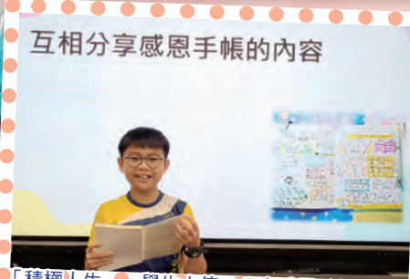
「積極人生——學生大使」分享感恩手帳內容。