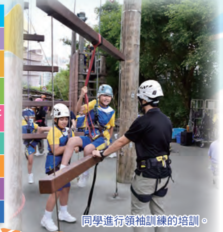
同學進行領袖訓練的培訓。