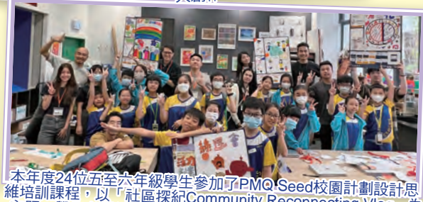
本年度24位五至六年級學生參加了PMQ Seed校園計劃設計思維培訓課程，以「社區探紀Community Reconnecting Vlog」為主題，學生在長沙灣區訪問街坊，學習訪問、攝影、剪片、配樂等技巧，分別創作了4段長沙灣特色的短片，其中一組同學更代表本校到學與教博覽分享成果。