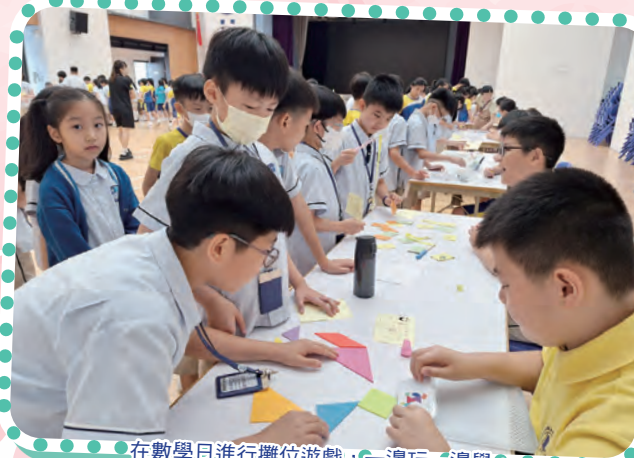
在數學日進行攤位遊戲，一邊玩一邊學。