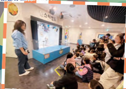
同學們都專注投入地觀看機械人的示範。