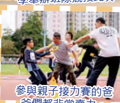
參與親子接力賽的爸爸們都非常賣力。

為了推動學生積極參與體育活動，體育科舉行了多項活動，包括親子運動日、體藝日及校運會。此外，亦加入了多元化的課程讓低年級學生學習花式跳繩，高年級學生參與新興運動「閃避球」及「巧固球」。