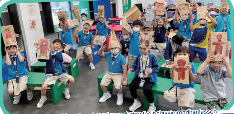
P.1 students making gingerbread men during their classic reading lesson.