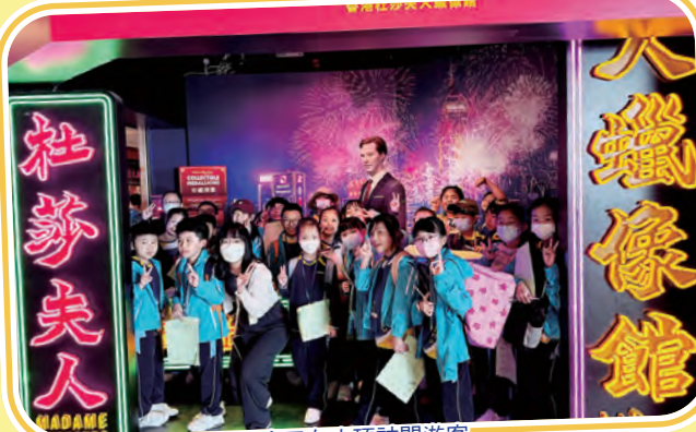
小三在山頂訪問遊客