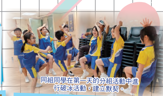
同組同學在第一天的分組活動中進行破冰活動，建立默契。

本校於2024年4月16至18日為小六學生舉行畢業營，學生進行了不同的個人挑戰活動及群體活動，讓他們可以挑戰自己及提升團隊合作能力。