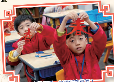
齊來學剪紙，增添新春喜氣！