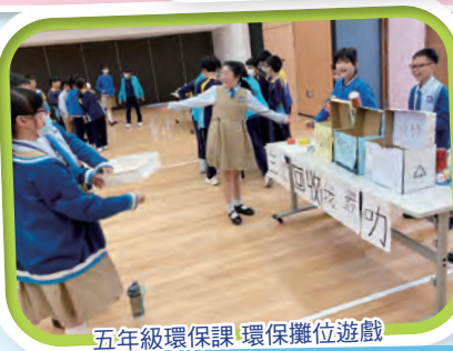
五年級環保課 環保攤位遊戲