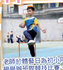
老師於體藝日為初小同學舉辦班際競技比賽。