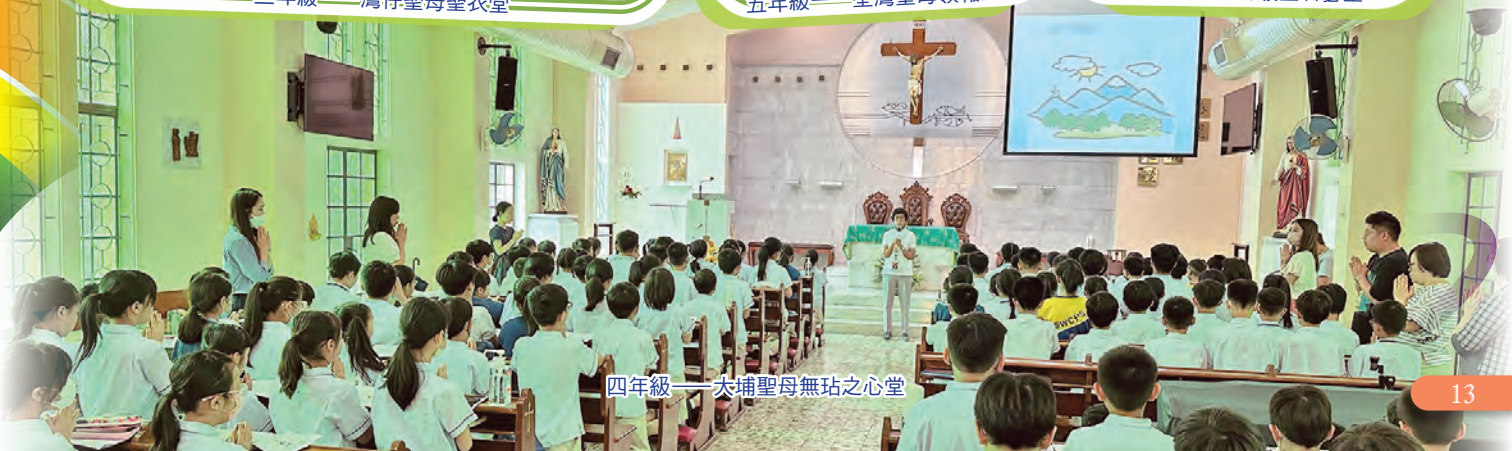
四年級——大埔聖母無玷之心堂