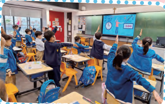
齊來做動作，唱歌學時間。

數學科採用多元化的教學策略、進行實作活動和善用資訊科技，引導學生主動學習，運用數學知識解決日常生活問題，並提升學生的運算、推理、解難和邏輯思維能力。看看他們在數學課堂活動和數學日的表現吧！