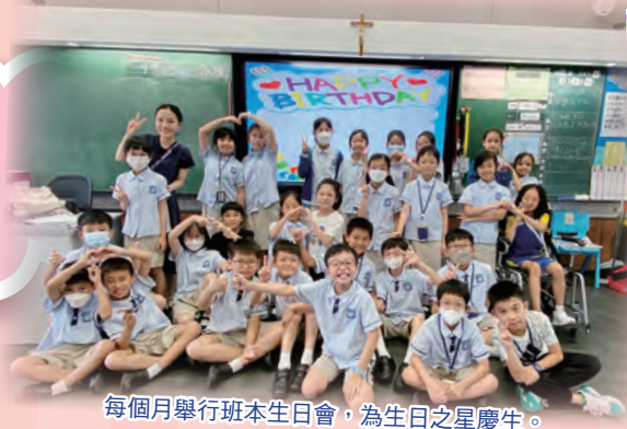
每個月舉行班本生日會，為生日之星慶生。

此外，透過推行校本「POWER UP獎勵計劃」，培養學生的良好品德，建立正確的價值觀及人生觀，讓學生不斷自我完善，提升自律及抗逆力。為全面照顧學生的需要，訓輔組會定期為家長提供工作坊及茶聚時間，邀請校外專業人士與家長們分享育兒心得，家長之間也可以互相交流。