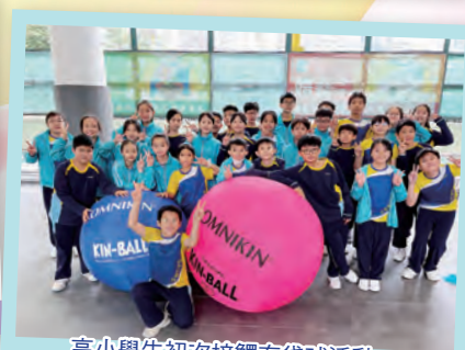
高小學生初次接觸布袋球活動。