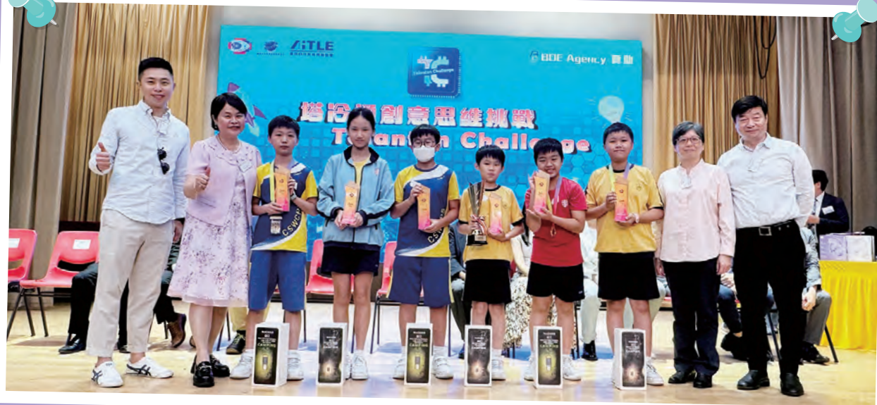
本校學生在教區全港STEAM挑戰賽奪得最佳方案獎。