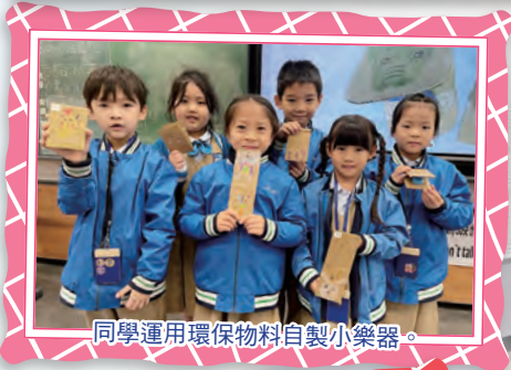
同學運用環保物料自製小樂器。