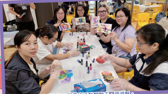
家長透過參與藝術活動聊天，減減壓。