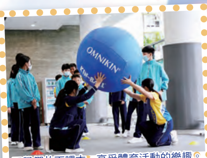
同學們放下課本，享受體育活動的樂趣。