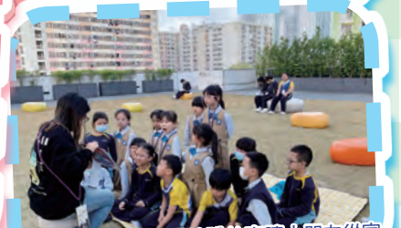
故事爸媽在不同的場地說故事讓小朋友從家長的帶動下認識更多的圖書。