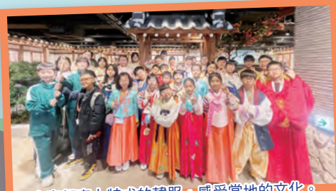
大家都穿上特式的韓服，感受當地的文化。