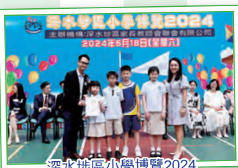
深水埗區小學博覽2024