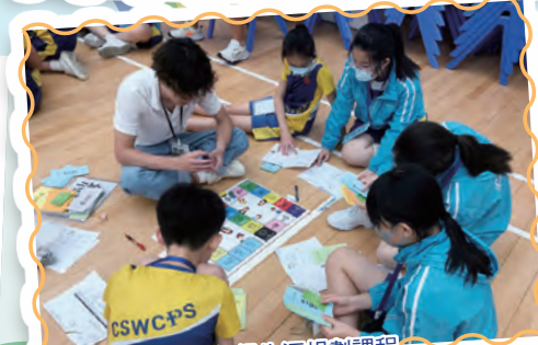
六年級生涯規劃課程