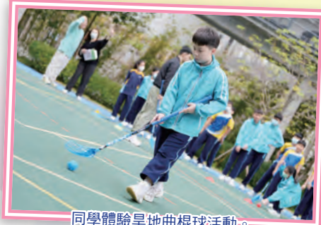
同學體驗旱地曲棍球活動。