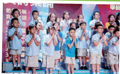
英詩集誦表演的詩歌是Bedtime，講述了小孩子想繼續玩，不想去睡覺的心情。