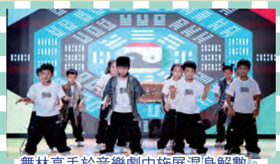
舞林高手於音樂劇中施展混身解數。