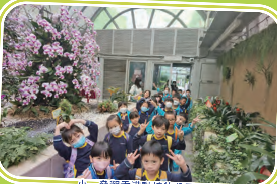
小一參觀香港動植物公園

透過戶外專題參觀和考察活動，除了讓學生將課本的知識活學活用外，還能發展學生的綜合能力，增加學生與人溝通的機會，亦讓學生了解香港及中國內地各方面的發展情況。