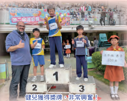
健兒獲得獎牌，非常興奮！