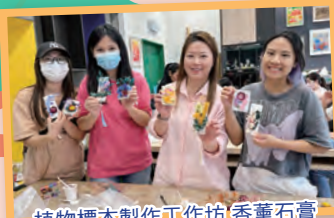
植物標本製作工作坊 香薰石膏