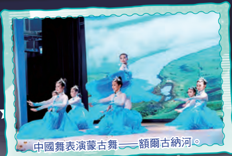
中國舞表演蒙古舞——額爾古納河。