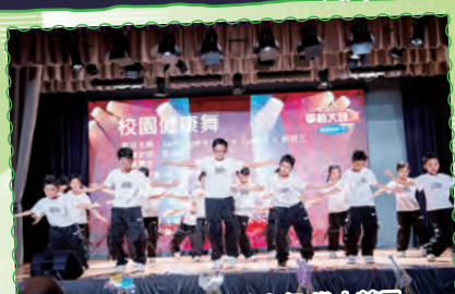
同學跳三首校園健康舞《當尊巴》(Zumba)讓同學爆汗消脂又舒壓！