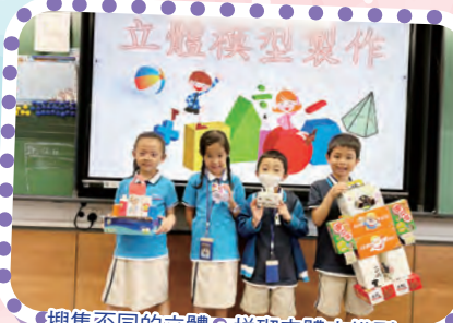
搜集不同的立體，拼砌立體大模型。