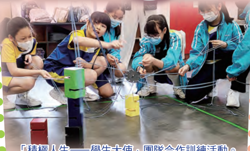
「積極人生——學生大使」團隊合作訓練活動。