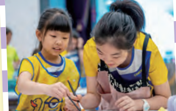
6月期間與慈雲山天主教小學、天虹小學共同舉辦了聯校視藝交流日，是次活動有八十多位同學進行視藝交流活動，以小組形式創作了二十多幅以香港為題的油畫布，並會進行巡迴展出。