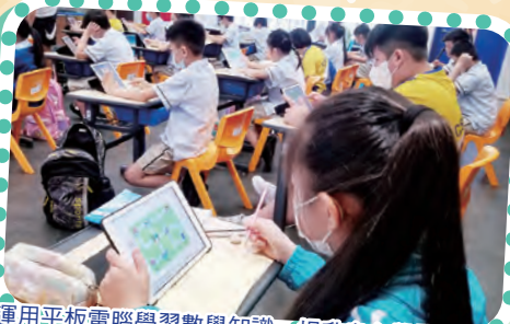
運用平板電腦學習數學知識，提升自主學習能力。