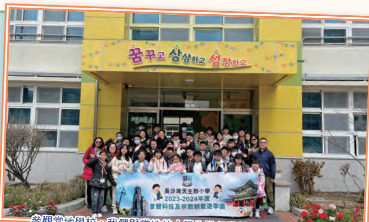
參觀當地學校，我們與當地的小學生進行遊戲及交流學校生活。