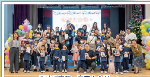
活動結束前，齊來大合照。