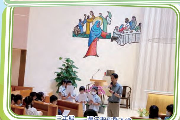
三年級——灣仔聖母聖衣堂

試後三至六年級進行分級朝聖日，各級學生均能親身到聖堂朝聖，加強學生對天主教聖堂的認識。