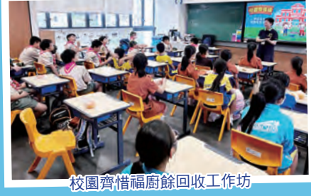
校園齊惜福廚餘回收工作坊