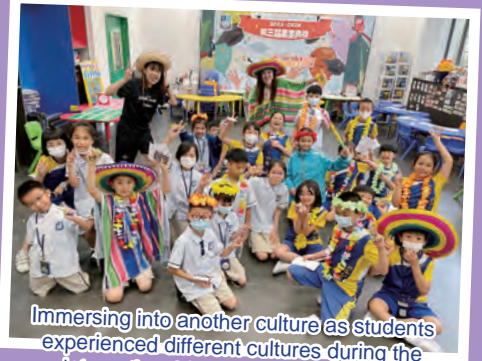
Immersing into another culture as students experienced different cultures during the international festival of English Day.