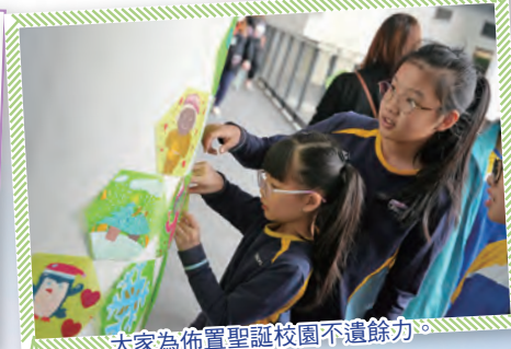
大家為佈置聖誕校園不遺餘力。