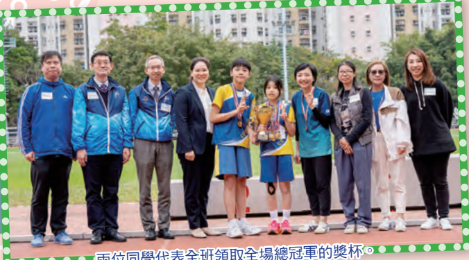
兩位同學代表全班領取全場總冠軍的獎杯。