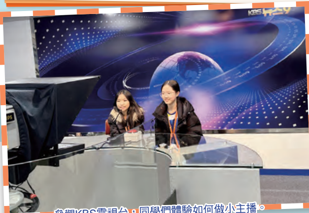
參觀KBS電視台，同學們體驗如何做小主播。

為豐富學生的學習經歷，加深他們對不同國家的歷史文化、宗教氛圍特色及科技發展等各方面的認識，學校於2024年3月25日至28日舉辦了「首爾科技及宗教朝聖遊學團」。由校內老師帶領約40位學生前往韓國首爾進行境外交流活動，當中參觀了切頭山聖地、景福宮、ROBOPARK機械人博物館、韓國文化體驗館，以及學校參訪等。