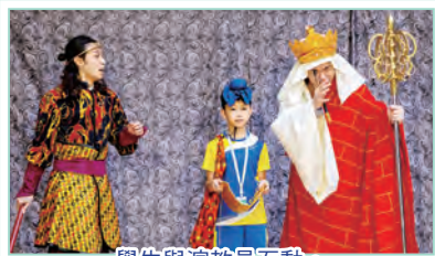
學生與演教員互動。

另外，本年度長天小劇團榮獲教育局主辦的「2023/24香港學校戲劇節」的多個獎項，包括：傑出整體演出獎和傑出合作獎，當中四位小演員更榮獲傑出演員獎。