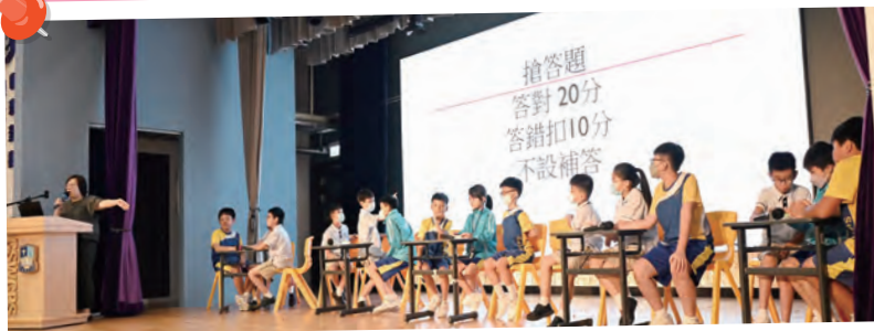
各班在STEAM DAY 進行問答比賽。

本校以多元化的模式推行STEAM教育，包括小一至小六STEAM校本主題學習課、STEAM DAY及課後STEAM精英培訓班，還參加了不同的STEAM比賽，讓學生有更多機會學習STEAM課程。