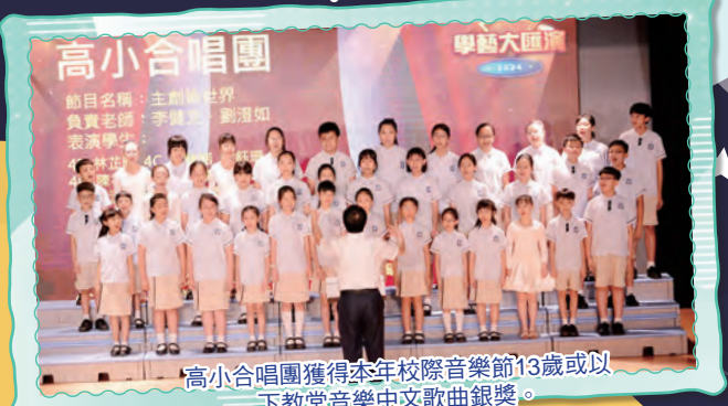
高小合唱團獲得本年校際音樂節13歲或以下教堂音樂中文歌曲銀獎。