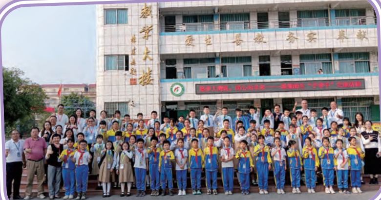
探訪姊妹學校——鼎湖區蓮花鎮真光中心小學