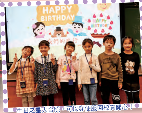
生日之星大合照，可以穿便服回校真開心！