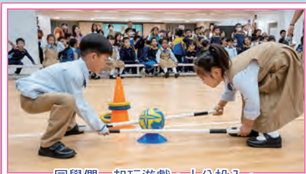
同學們一起玩遊戲，十分投入。

為慶祝小一新生加入長天小大家庭100天，本校於12月12日舉辦了「小一百日宴」活動。當天老師、家長及學生一起透過遊戲及觀看成長片段分享喜悅。