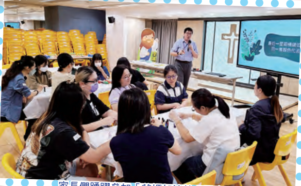
家長們踴躍參加「爸媽加油站」聚會。