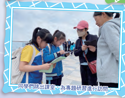
同學們跳出課室，為專題研習進行訪問。