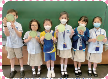
製作繡曲線書籤，欣賞數學之美。