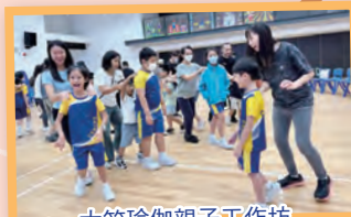
大笑瑜伽親子工作坊