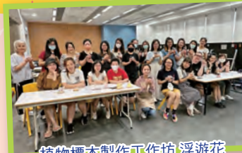
植物標本製作工作坊 浮遊花