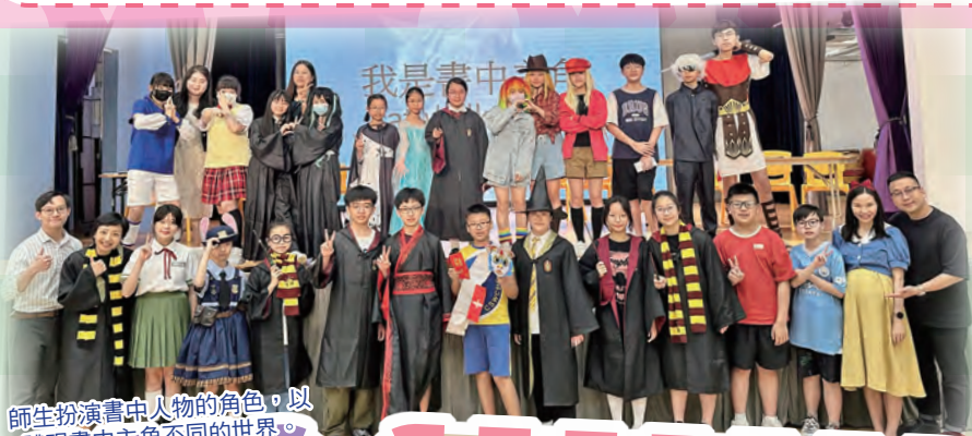
師生扮演書中人物的角色，以體現書中主角不同的世界。

恆常閱讀能培養語文能力，六日的循環周中有三節靜讀課以培養學生閱讀的習慣。當中更加入一天的英語閱讀日，增加英語閱讀的機會。特定的閱讀早會讓全校師生透過分享好書成為閱讀的推動者，以及鼓勵同儕／學生閱讀，加強閱讀風氣。「故事爸媽」為初小學生說故事，除了加強學生的閱讀興趣外，亦可讓家長透過參與本校閱讀活動了解及感受閱讀的好處。