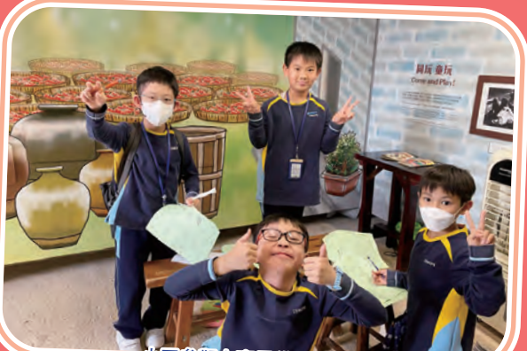
小四參觀上窰民俗文物館