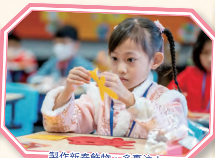
製作新春飾物，多專注！