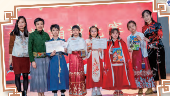
普通話詩詞誦讀比賽，欣賞古詩的韻味！