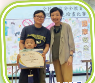
「全民國家安全教育日」 2024-親子填色繪畫比賽