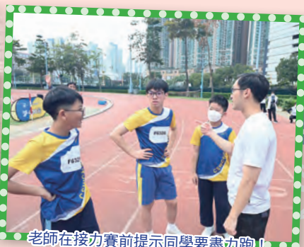
老師在接力賽前提示同學要盡力跑！