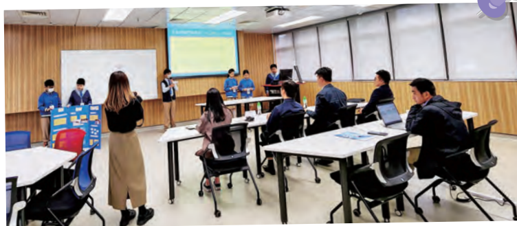
學生在深水埗區STEAM比賽中向評委介紹本校團隊設計的產品。