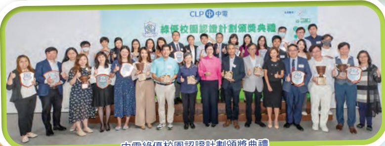
中電綠優校園認證計劃頒獎典禮