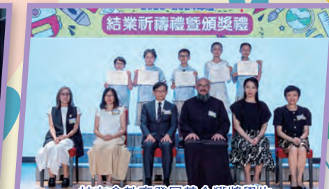
校友會教育發展基金獲獎學生