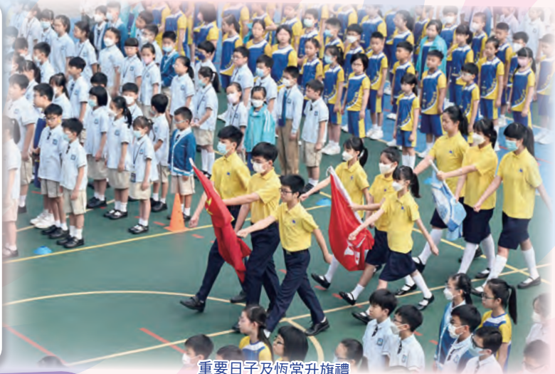
重要日子及恆常升旗禮