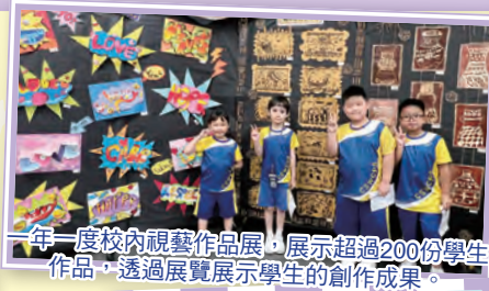
一年一度校內視藝作品展，展示超過200份學生作品，透過展覽展示學生的創作成果。