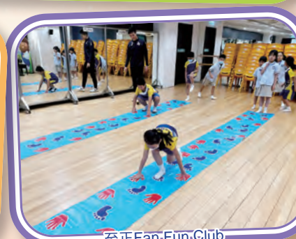
至正Fan Fun Club