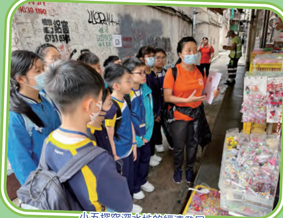
小五探究深水埗的經濟發展