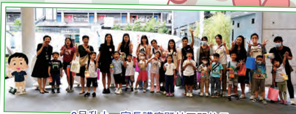
9月升小一家長講座暨校園開放日