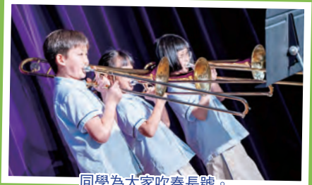
同學為大家吹奏長號。