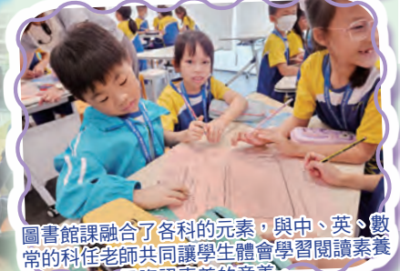
圖書館課融合了各科的元素，與中、英、數常的科任老師共同讓學生體會學習閱讀素養及資訊素養的意義。