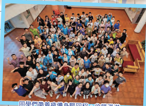
同學們帶着疲憊身驅回程，收獲滿滿。