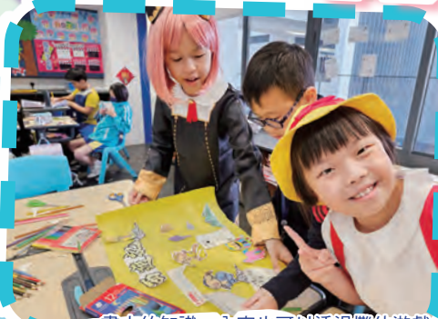
書中的知識、內容也可以透過攤位遊戲／動手做的形式表達出來，從遊戲中學習。