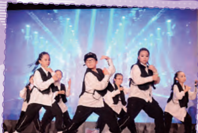
Hiphop隊員在本年度贏取全港小學組街舞比賽季軍及網上最具人氣大獎金獎，他們希望用熱舞燃點所有人心中的一團火。