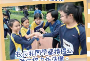
校長和同學都積極為師生接力作準備。