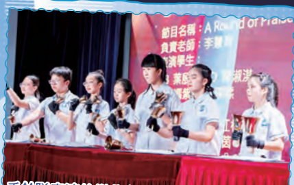
手鈴隊表演的樂曲名為A Round of Praise，樂曲旋律優美。