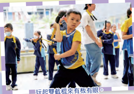
玩起雙截棍來有板有眼。