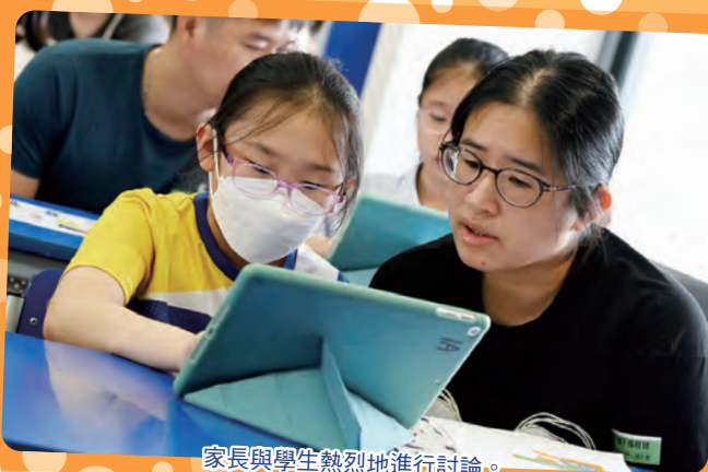
家長與學生熱烈地進行討論。

除了透過電腦科校本課程向學生解說外，還舉行親子編程工作坊。家長與子女一起學習何謂資訊媒體素養，內容包括網購、網上交友、網上欺凌等主題。