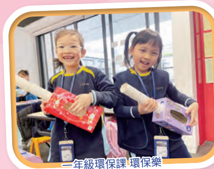
一年級環保課 環保樂