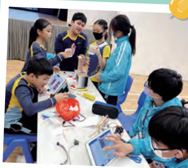
學生在STEAM 主題學習課利用Microbit 製作智能校園產品。