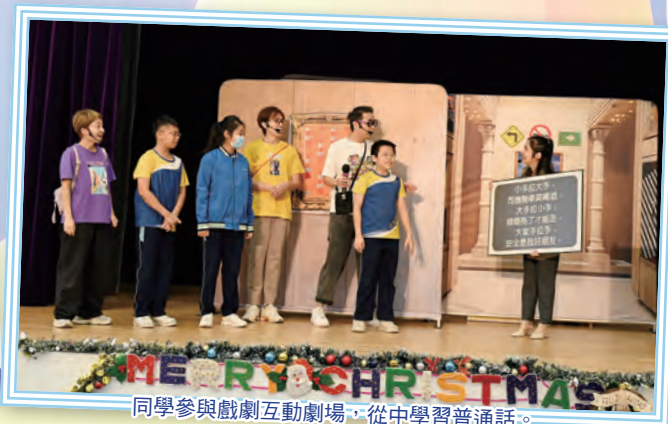
同學參與戲劇互動劇場，從中學習普通話。