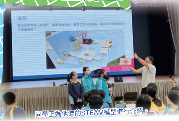
同學正為他們的STEAM模型進行介紹。