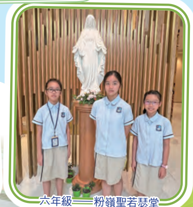
六年級——粉嶺聖若瑟堂