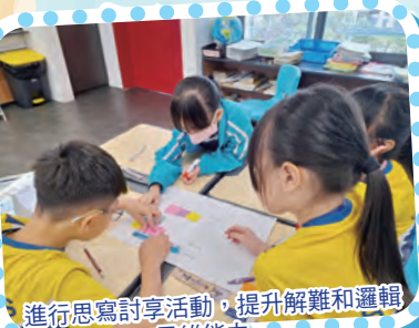
進行思寫討享活動，提升解難和邏輯思維能力。