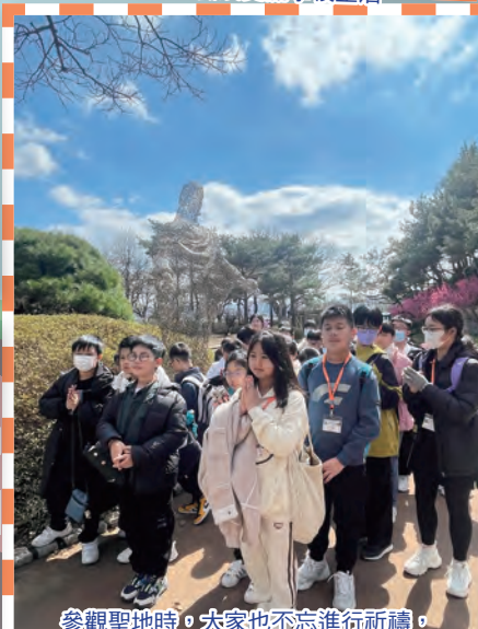
參觀聖地時，大家也不忘進行祈禱，感受聖靈的祝福。