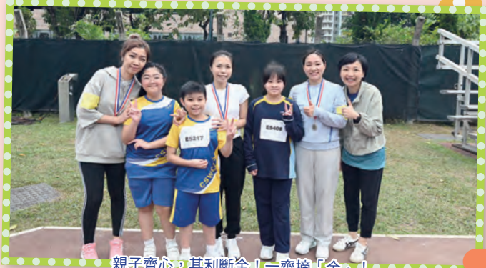
親子齊心，其利斷金！一齊搞「金」！