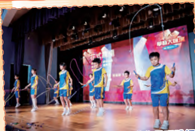
花式跳繩隊以獨特的節奏和動作呈現跳繩運動的魅力。