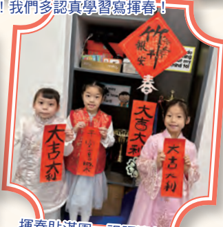
揮春貼滿園，祝福迎新歲！