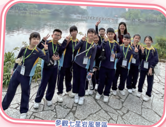
參觀七星岩風景區