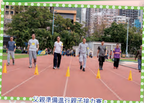
父親準備進行親子接力賽。

第二屆校運會於2024年2月6日順利舉行，當天參與的師生們士氣高昂。高唱校歌後，各級別的田徑賽事陸續開始，所有健兒都拼盡全力，展現出卓越的體育技能及運動精神。今年新增的親子接力賽亦大受歡迎，約有300對親子參加。整個活動在歡樂互動的氣氛中進行，最終在熱烈的掌聲中圓滿結束。