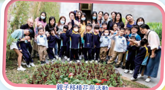
親子移植花苗活動