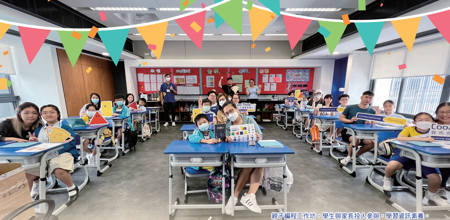
親子編程工作坊，學生與家長投入參與，學習資訊素養。