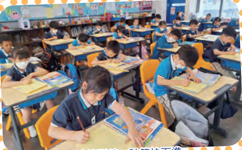
進行速算訓練，計算快而準。