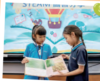
同學們在STEAM DAY 進行閱讀活動後與大家分享。