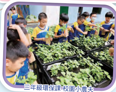
三年級環保課 校園小農夫