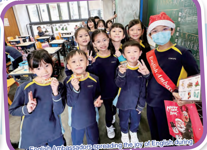
English Ambassadors spreading the joy of English during different festivals.