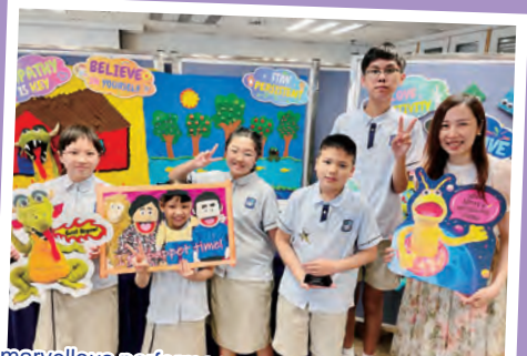
A marvellous performance saw our Puppetry Team get the second prize for the Story to Stage competition.

We promote Reading across the Curriculum (RaC) collaboration to support STEM (Science, Technology, Engineering, and Mathematics) education. This is done to enhance students' interest and capability in science, technology, and mathematics, as well as to cultivate their proficient use of English for personal intellectual development and further studies. Enriching said skills will provide a platform for students to progress onto the next stage of development, writing.