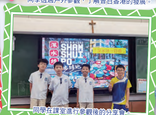
同學在課室進行參觀後的分享會。