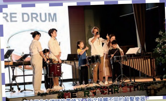
初小學生在導師的帶領下，首次接觸不同的敲擊樂器。

為了豐富學生不同學習的經歷，體驗體育及藝術之美，學校每年均會在12月舉行「體藝日」。音樂科、視藝科、體育科及戲劇科分別舉辦不同的工作坊、新興活動體驗、音樂會、戲劇欣賞等，讓師生得以嘗試各式各樣的體藝活動，放鬆身心，拓寬眼界。