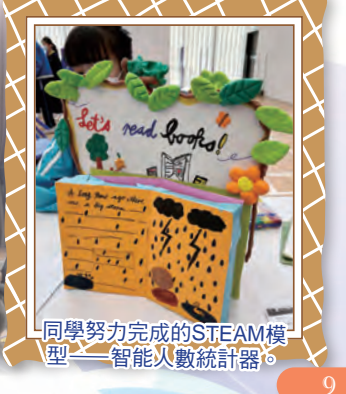
同學努力完成的STEAM模型——智能人數統計器。