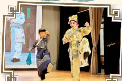
認識及欣賞國粹——粵劇·多投入！

中文科及普通話科於本年度推行了多類型的活動，包括午息活動、中文拔尖班、中秋猜燈謎等，而最具特色的主題活動就是一年一度的「中華文化日」，讓學生透過豐富而有趣的學習活動，如欣賞粵劇、寫揮春、製作新春掛飾、參與攤位遊戲及普通話詩詞誦讀比賽等，增加學生對中國傳統文化的認識，提升文化素養。