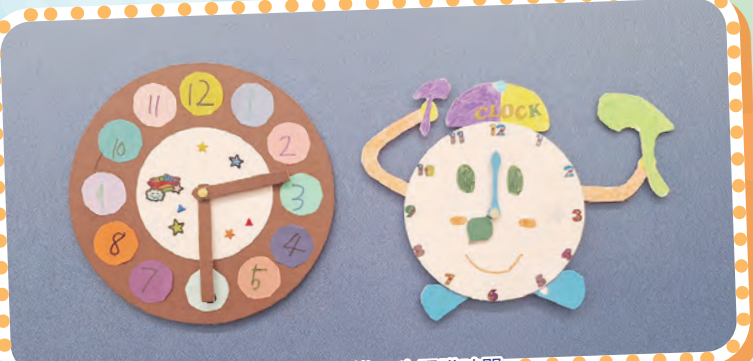
齊來動手做，進一步認識時間。