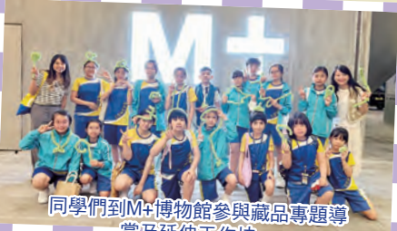
同學們到M+博物館參與藏品專題導賞及延伸工作坊。

此外，學生參與全校性聖誕裝飾佈置、宗教日合作畫創作、PMQ Seed校園計劃、視藝拔尖班、陶藝班、參與藝術展覽和比賽等多元化的藝術活動，豐富學生的藝術體驗，發展藝術潛能，從生活中學懂欣賞和發現美。