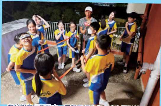
在分組夜行活動中，同學互相合作，建立團隊精神。