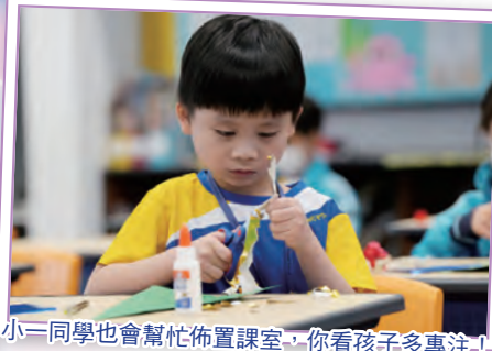
小一同學也會幫忙佈置課室，你看孩子多專注！