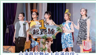
小演員於舞台上充滿自信。