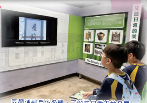
同學透過戶外參觀，了解昔日香港的發展。