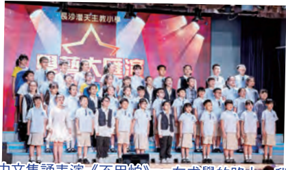
中文集誦表演《不用怕》，在求學的路上，我們總會遇到很多的挫折和困難，但都不用怕。