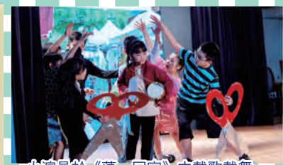
小演員於《蕩·回家》中載歌載舞。