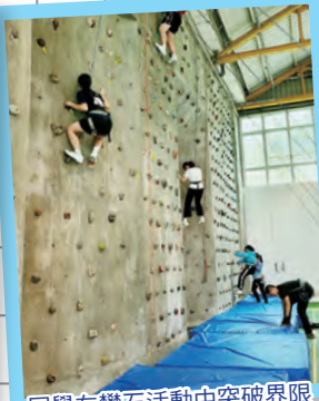
同學在攀石活動中突破界限，挑戰自我。