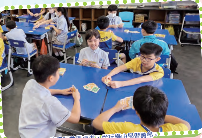
齊來玩數學桌遊，從玩樂中學習數學。