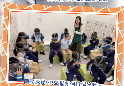
同學透過VR學習如何珍惜食物。