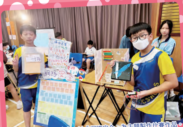
學生出外參加編程比賽，以「網路安全」為主題製作比賽作品。