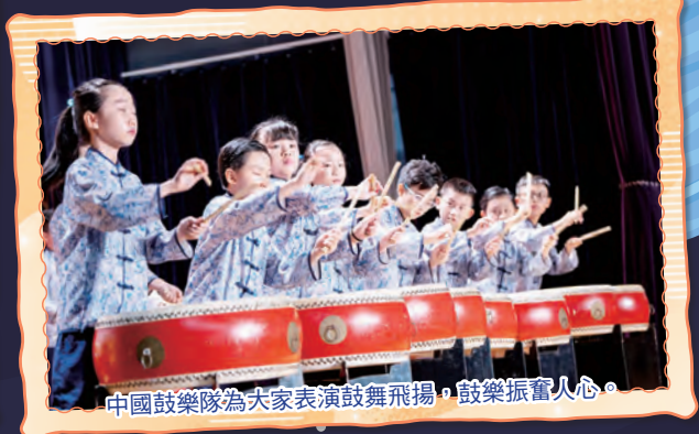
中國鼓樂隊為大家表演鼓舞飛揚，鼓樂振奮人心。