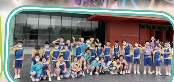
香港故宮文化博物館參觀活動