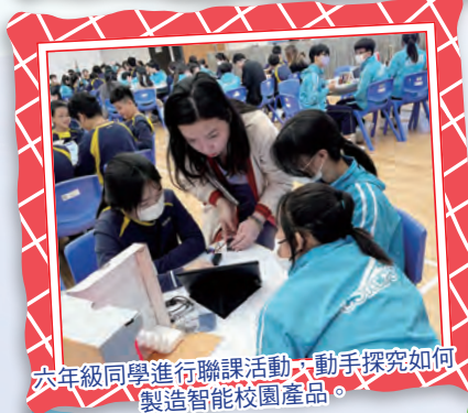
六年級同學進行聯課活動，動手探究如何製造智能校園產品。