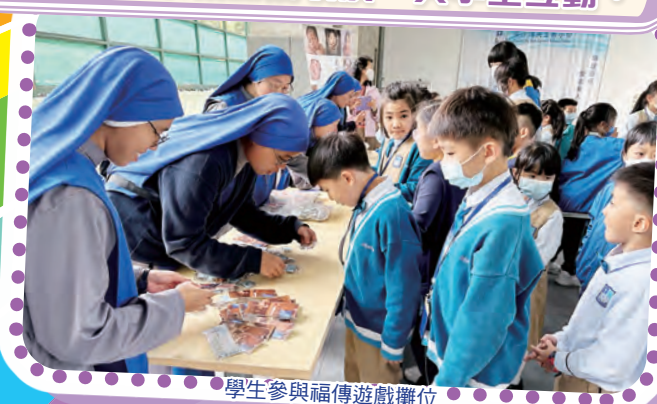
學生參與福傳遊戲攤位