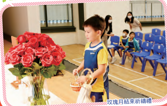
玫瑰月結束祈禱禮