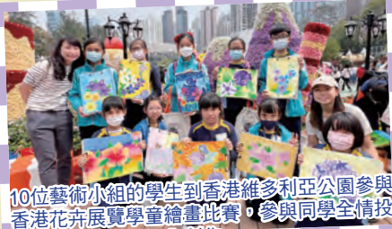
10位藝術小組的學生到香港維多利亞公園參與香港花卉展覽童繪畫比賽，參與同學全情投入創作。